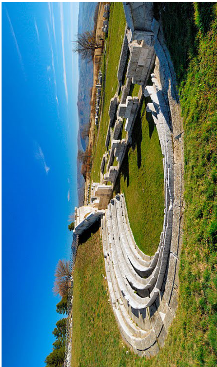
Teatro Sannitico di Pietrabbondante (Molise) - Italy