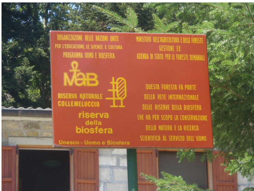
Riserva Collemeluccio (Alto Molise)