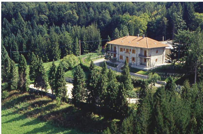
Riserva MAB - Montedimezzo (Alto Molise)

DOMENICO LANCIANO (Badolato di Calabria, 04 marzo 1950)